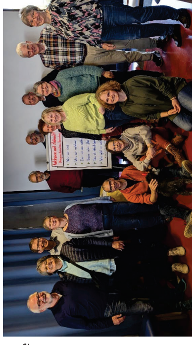
15 von 20 aus dem „harten Kern“

Wir sind eine Interessengemeinschaft, die Ideen für ein Wohnprojekt, im Zuge der geplanten Neugestaltung des Aischbachtals in Herrenberg ausarbeitet. Im harten Kern sind wir 20 Personen in und um Herrenberg, die sich aktiv beteiligen.